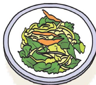
大豆もやしの香味ポン酢和え

※「春野菜の鶏そぼろ丼」と「大豆もやしの香味ポン酢和え」を組み合わせた定食で提供します。