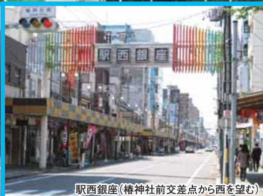
駅西銀座(椿神社前交差点から西を望む)