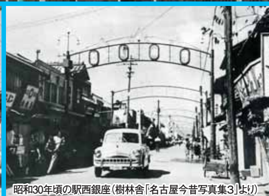
昭和30年頃の駅西銀座(樹林舎「名古屋今昔写真集3」より)

継続長期組合員(退職派遣者)は、長期給付のみの対象となります。短期給付・保健事業の対象となりませんのでご注意ください。